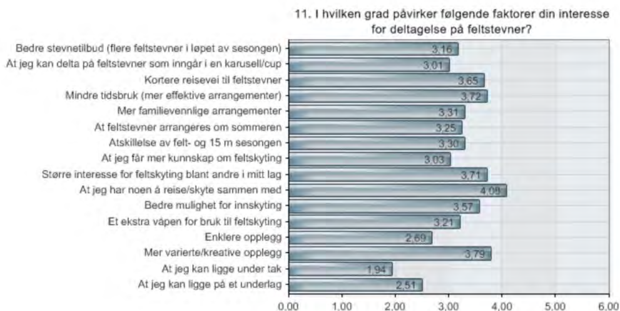
Figur 2: Oversikt over faktorer som påvirker skytternes interesse for deltakelse på feltstevner.

På spørsmålet om hvilke forhold som påvirker interessen for deltakelse på feltstevner svarte skytterne på en skala fra 1 til 6, hvor 6 henspeiler på at faktoren er svært viktig. Gjennomsnittlig score for ulike faktorer fremgår av figur 2 (ref. vedlegg 1).